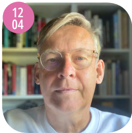
BART LOOTSMA DOCENTE IN TEORIA DELL'ARCHITETTURA UNIVERSITÀ DI INNSBRUCK